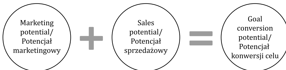
Figure 1. The synergy of marketing potential and sales potential determines the goal conversion potential

Potencjał marketingowy to liczba klientów możliwych do wprowadzenia na ścieżkę zakupową. Konwersja celu jest miarą synergii potencjału marketingowego i sprzedażowego (Rysunek 1). Stanowi informację o skuteczności podjętych działań marketingowych i skuteczności witryny internetowej, które to zaowocowały realizacją określonego celu. Nie bez znaczenia jest fakt, że wzrost konwersji celu wpływa na wzrost potencjału marketingowego, co z kolei oddziałuje na potencjał sprzedażowy.